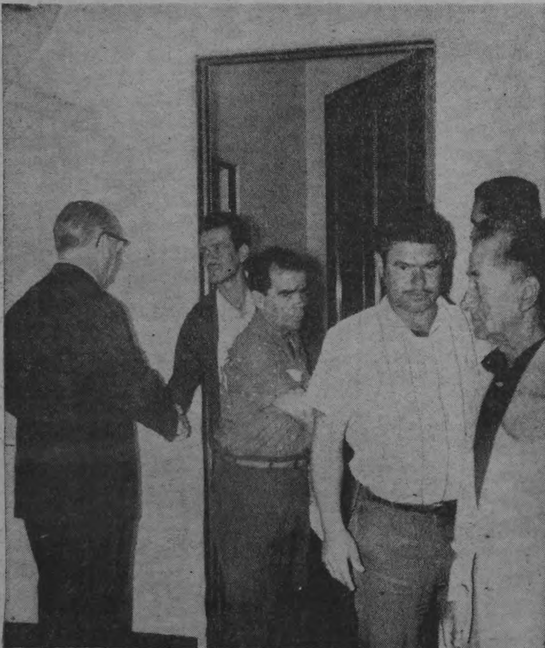
Gráfica tomada ayer en la mañana cuando el señor Presidente Orlich recibía, sin intermediaristas, a los delegados del Sindicato de Trabajadores de la Municipalidad de San José.