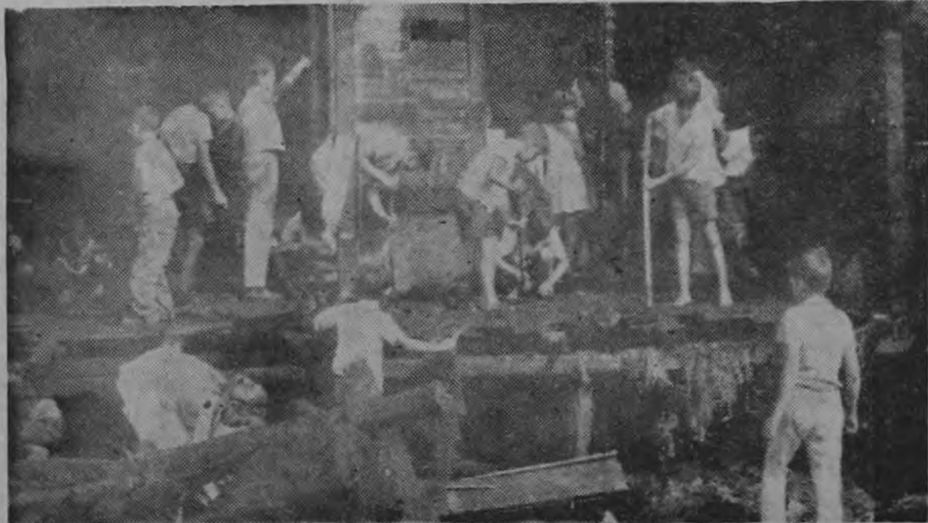
Aún las nubes de humo rodean el lugar donde estuvo una joyería. Menores de edad tratan afanosamente de buscar en los escombros, a ver "si se encuentran una pieza de oro. Quién quita!!"

Las autoridades no han establecido aún cómo se inició el fuego en estas residencias, por que mientras unos vecinos ase