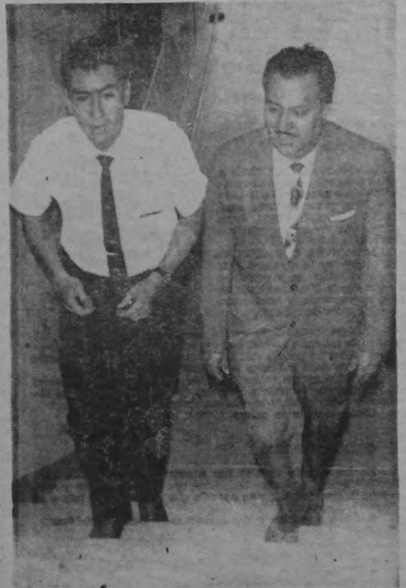
...Mientras subía escalinatas del Ministerio de Trabajo, el notable futbolista daba declaraciones a nuestro cronista.

Los paulistas jugarán el jueves contra el Aurora, excampeón local figuró en el cuarto lugar en el último torneo organizado por la Liga de primera división.